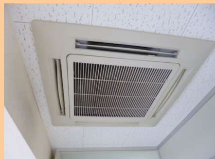
①機種確認・ブレーカー位置確認