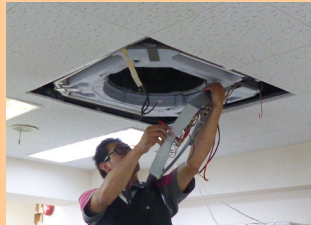
③エアコン分解作業