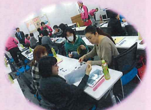
グループごとに分かれて、 協力しあっての資機材選び その②