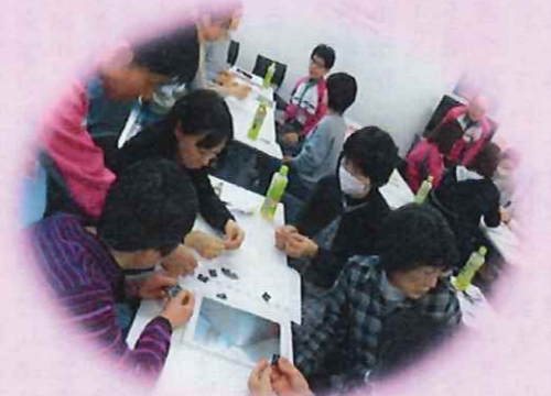
グループごとに分かれて、 協力しあって資機材選び その①