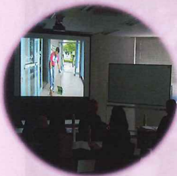
会社案内DVDを視聴中 会社の歩みを皆で確認しました