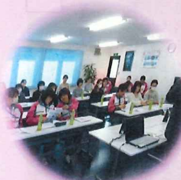
現場は違っても、同じ仲間。 受講中もお互いに助け合います