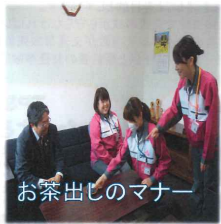
お茶出しのマナー