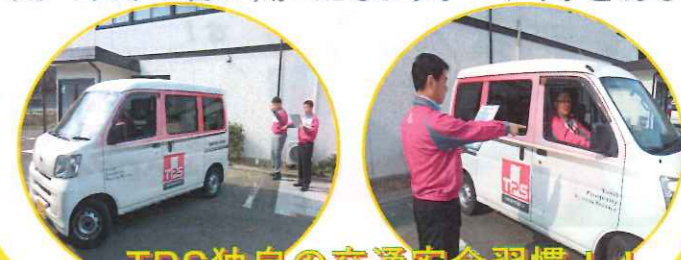
TPS独自の交通安全習慣!!