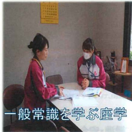
一般常識を学ぶ座学

今までもTPSマスター制度に沿って新入社員の研修を行ってきましたが「ビューティーコンシェルジュ」により近づいていけるよう見直しを行なっています。一般常識から実務研修までさらにパワーアップした社員研修を行なっていく予定です。また研修内容の充実だけでなく、この研修をYouTubeに限定公開でアップロードし、研修内容を見返したい時に復習出来る様に準備中です！