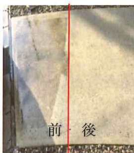
★ アプローチ床作業中

8月14日に知人宅の掃除を手伝い、ガラス・ベランダの床と壁、及びアプローチの床をスチーム洗浄で掃除しました。暑さと休みボケ?で最後は全員へトへトになりました。それでも、仕上がりは満足いくものになりました。