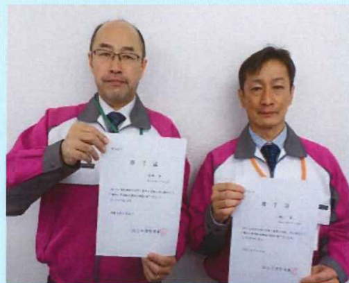
修了証をいただき 晴れて新米防火管理者です！

不特定多数の人が集まる各種施設などで選任が義務付けられています。火事を未然に防ぐための管理をする人のことをいいます！ 火災等による被害を防止するため、それぞれの施設や店舗に見合った消防計画を作成し、計画的に管理をする責任者のことです。 消防法によれば、建物の所有者など防火対象物に対する管理権限をもつ人が、各施設の防火管理人を任命し任命された人はその任務を果たさなければなりません。