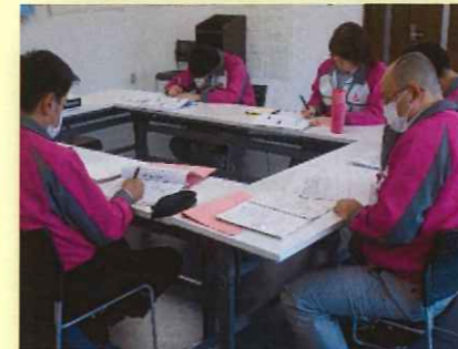
参加メンバーは各部長、課長、係長の6名です。

TPSは2019年10月に第28期を迎えました。今期は多くの社員からの意見を受け止めて「人事評価制度見直し」のためのプロジェクトをスタートさせました。プロジェクトを推進していくためにまずはじめにとりかかったのは「管理職研修」です。制度を見直すだけではなく、運用を成功させるために重要なマネジメント力の高い管理職チームになるべく研修を毎月開催しています。