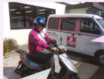
TPS社有車はピンクが目印

TPSといえば、街でよく見かける白×ピンクのロゴの社有車がお馴染みです。毎日数台の車が、街のあちこちで動き回っています。そんな中、ちょっとした巡回用にと仲間入りした原付号！車を止めづらい物件や狭い道、近隣へのちょっとした資機材のお届けなどに威力を発揮します。原付1種(50cc)は普通自動車免許があれば乗れますので、天気の良い日ちょっとした業務にはもってこいですね！TPSにも数名のバイク好き社員がいますので、今後ますます活躍しそうな原付号でございます☆