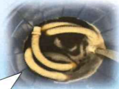
回収した汚水がこちら!!!

春の特別企画として、業務用エアコン分解洗浄キャンペーンを3月より開始致しました！ 業務用エアコンの洗浄は、簡易的なフィルターの清掃だけではなく、機械を分解し、各 부품の洗浄を行うことで、長年の汚れやゴミ、または異臭の原因となる「カビ」を取り除きます。洗浄後は、 環境的にも、経済的にも良い効果 を伴います☆