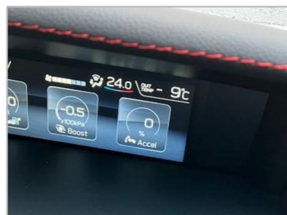
↑車の温度計は-9°の表示！

また今回の寒波の影響で、各所で水道管が破裂し漏水の案件が多々ありました。見える場所だけでなく、壁や天井裏など老朽化が原因の場所もありましたが、出来る限りの対応をさせていただきました。