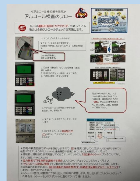
↑弊社独自のアルコール検査の手順書