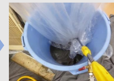
↑洗浄作業後の汚水の状態