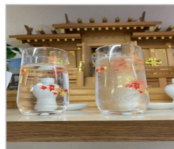
↑神棚の水も凍結しました！