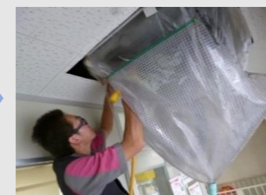
↑養生と洗浄作業の様子