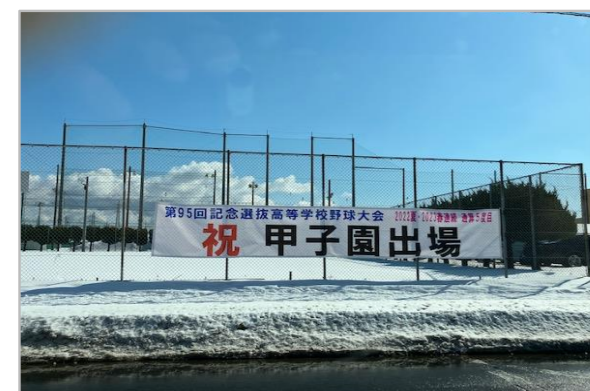
↑能代松陽高校の様子

秋田の冬という、毎年なにかと寒いことばかりですが、今年は熱いこともありました！ 我が母校でもあります能代松陽高校（旧能代商業）が初の選抜高校野球大会出場となりました。開幕は3月18日ということなので、優勝目指して選手の皆さん頑張ってください！！