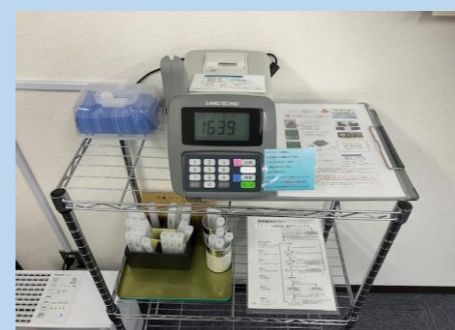
↑アルコール検知器セット

弊社では2/13から検査機器を使用したアルコールチェックが開始本格的に始動致しました。勿論のこと、数値でNGがでると運転はできないので、飲みすぎた次の日は恐る恐る検査する感じです。が、意外と大丈夫で安心する毎日です。これからも、アルコールチェック違反者ゼロ、交通事故ゼロを目指して、安全第一で業務に励んでいきたいと思ひます。