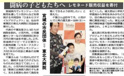
↑ 東北大学病院へレモネード販売収益を寄付 (掲載記事: 河北新報)

ひまわりスマイルプロジェクトとは・・・ 小児がんの子供たちとその家族をサポートするため、ご自身のお子さんを脳腫瘍で亡くしたお母様と兄弟で立ち上げた宮城県唯一の支援団体です。