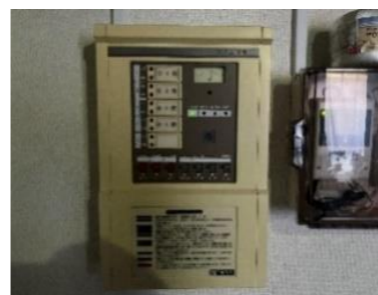
約35年頑張った受信機です。

火災受信機は大きく分けてR型・P型とあり、P型には1級、2級と呼ばれる類別があります。当該建物の火災を警戒するエリアが5箇所以内で足る場合は2級受信機を使用することができます。今回は4階建てで1フロアごと4警戒となる建物なのでP型2級受信機となります。