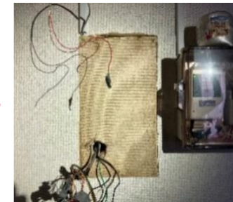
配線を全て離線し本体を取り外します。跡が目立つため、目隠し用に薄板を取付けます。