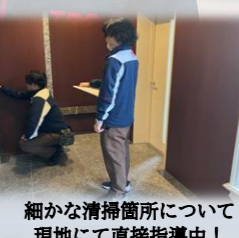
細かな清掃箇所について現地に直接指導中！

現場で得た気づきをそのまま次に活かせる体制を整え、日々試行錯誤を重ねながら、現場力を高めていきたいと思っております！