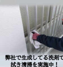
弊社で生成している洗剤で拭き清掃を実施中！

物件では日々の日常清掃だけではなく、小さな変化や異常箇所があればその場で写真撮影し報告をいただいております。また、清掃指導や振り返りを行い、良い点・改善点を即座に洗い出すだけではなく、仕組み化まで行いながらより良いサービス作りに取り組んでいます。