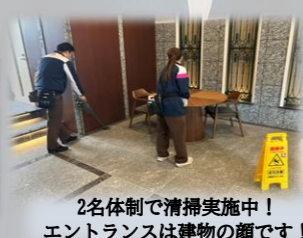
2名体制で清掃実施中！エントランスは建物の顔です！