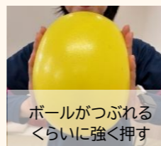
ボールがつぶれるくらいに強く押す